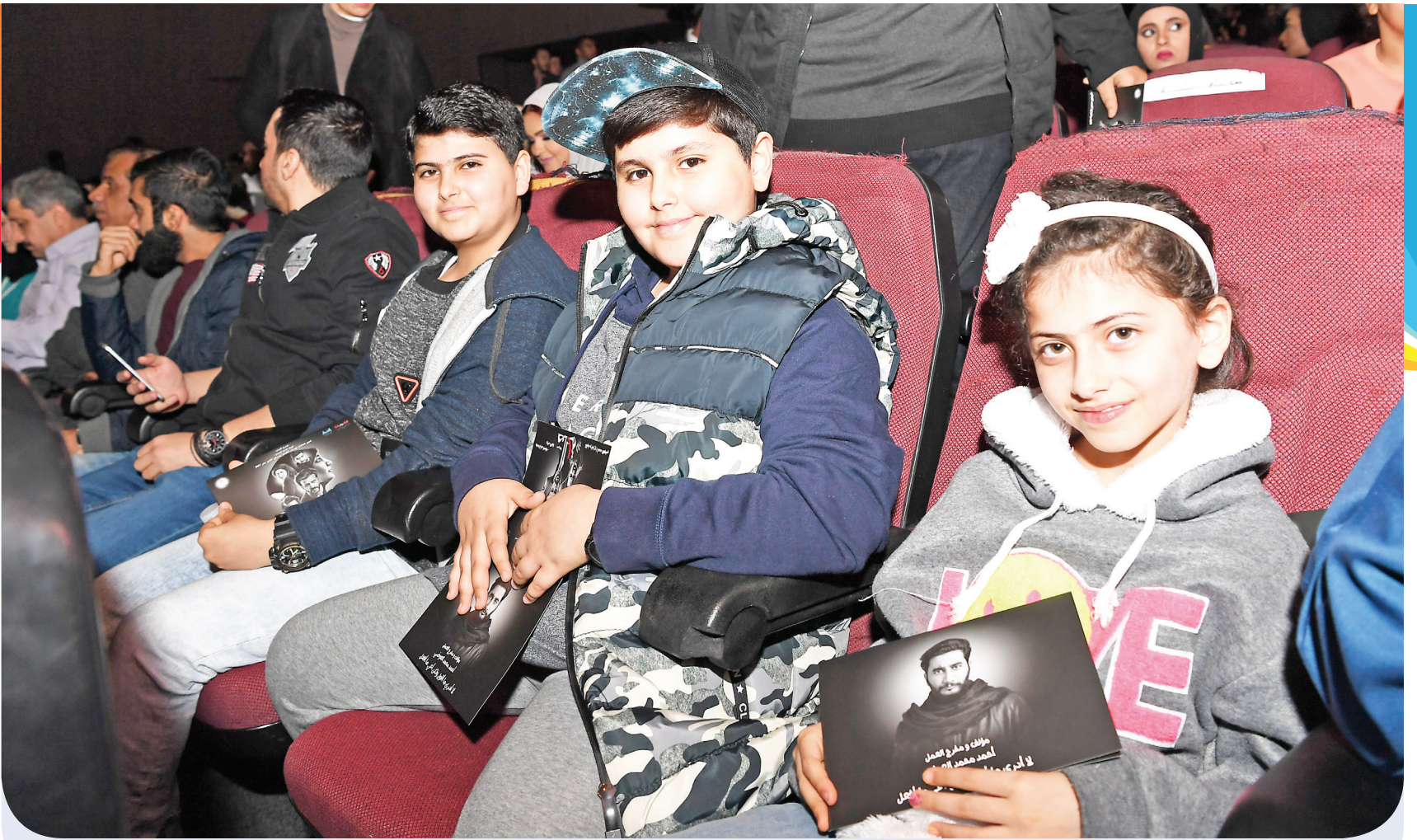
براعم المسرح .. حاضرون