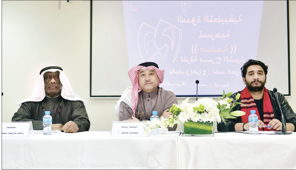
جانب من الندوة التطبيقية

حيث نجد وجه الممثل حتى وهو خلف الحاجز، والملابس أشعرتنا بأننا قريبون من بيتهم ونُحلّق في خيالنا ونرى مجتمعا آخر.