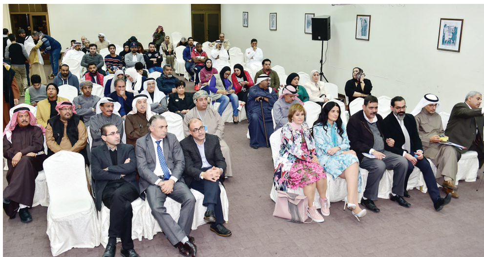
جانب من حضور الندوة