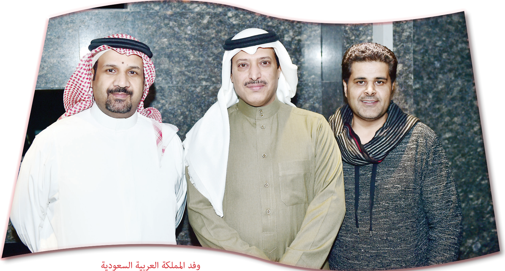
وفد المملكة العربية السعودية

قال: «هناك وجود للمرأة في الدراما وهو واضح من خلال الأعمال التي نشاهدها، ونتمنى أن يسهم قرار وزير الثقافة بمنع أي عمل يشوه صورة المجتمع السعودي في تقديم صورة حقيقية وصحيحة عن المرأة في السعودية».