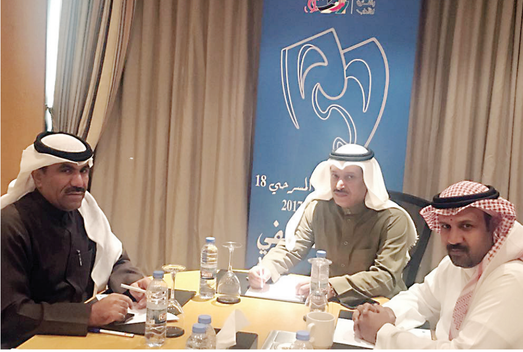
جانب من الجلسة الحوارية